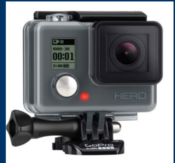
GO PRO HERO